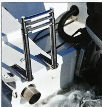
Les dalots d'évacuation du cockpit ressemblent à des échappements aériens.