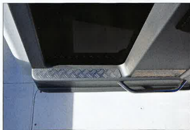
Souci du détail : des plaques métalliques et antidérapantes sont fixées à l'entrée de la cabine et devant le repose-pieds.