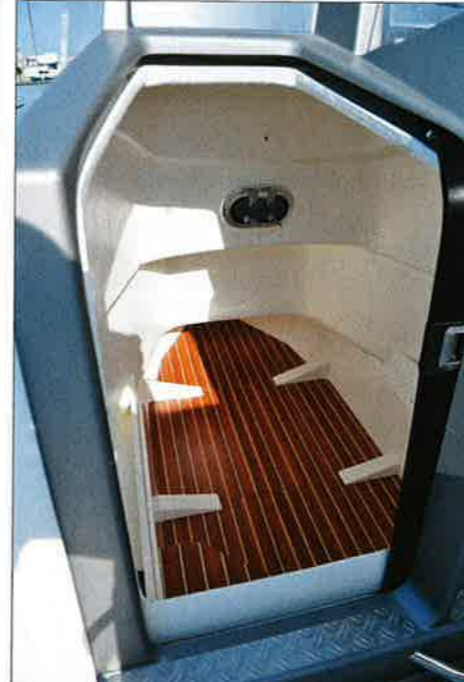
La cabine est plus un espace de rangement qu'un lieu où passer une nuit confortable.